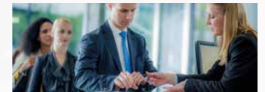
Bancos e instituciones financieras