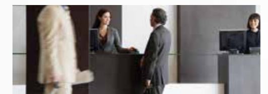
Sector de la hostelería, incluyendo hoteles