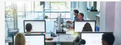
Pequeñas y medianas oficinas, junto con entornos empresariales